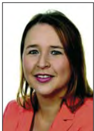
Stadträtin Esther Pranghofer-Weide